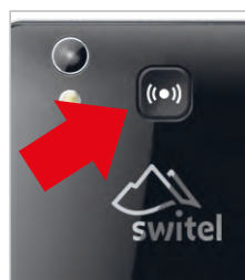
Seconda parte posteriore senza pulsante SOS incluso