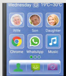
Display con caratteri e simboli grandi