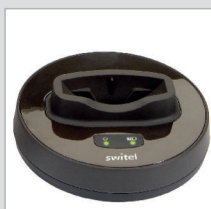
Lade- und Dockingstation