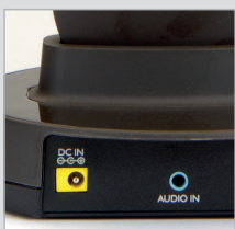
Eingangsbuchsen Netzteil und Analog-Anschluss