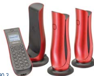
DF 1853 Trio EAN 76 401 1001 897 2